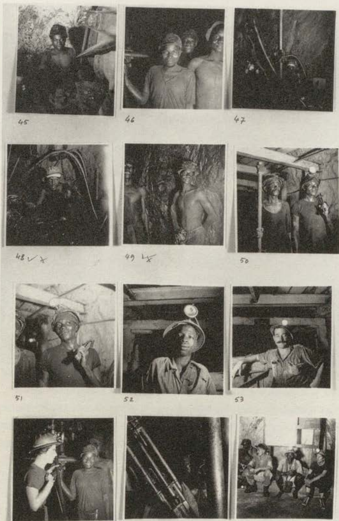
Mineurs venus de la savane du Nord et d'ailleurs, Obuasi (Ghana), 1954-1955. Mission " Gold Coast, 1954-1955 ", Inv. 1999-7928-923 Contacts collés sur papier, montage original par Jean Rouch