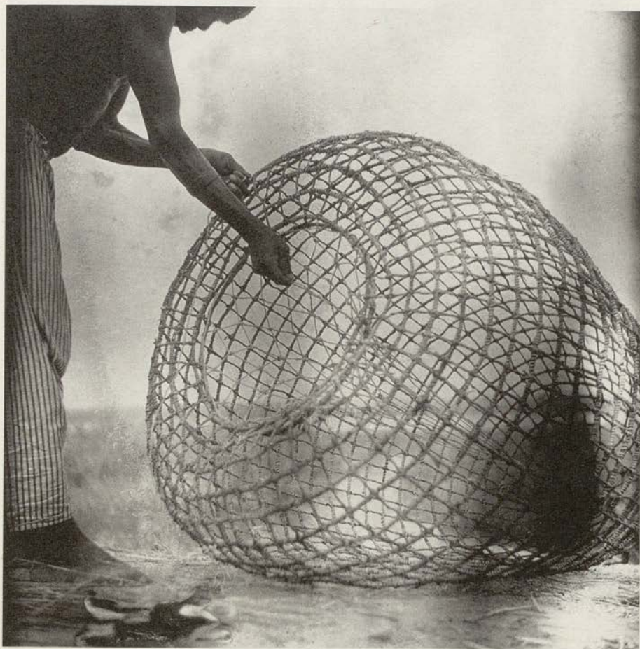
Tissage d'une gura (nasse), Tondikwara (Niger), 1947, Mission " Fleuve Niger ", Inv. 1999-6918-923-E