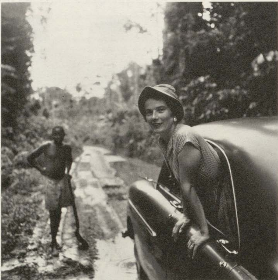
Région de Samreboi (Ghana), 1954-1955, Mission " Gold Coast, 1954-1955 ", Inv. 2000-2943-923 (vue 72)