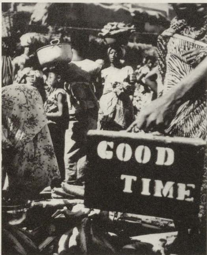
Good Time, Ciné-marché, Kumasi (Ghana), 1954-1955. Mission "Gold Coast, 1954-1955", Inv. 1999-7896-923