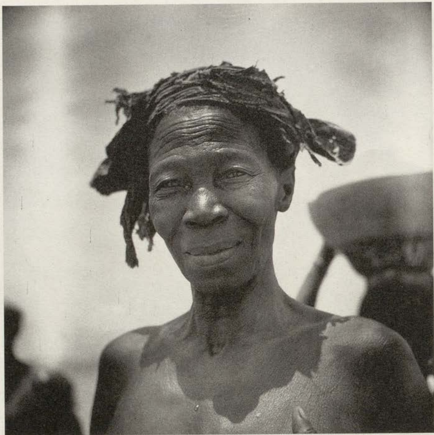
Femme kakanda, Lokoja (Nigeria), 1947, Mission " Fleuve Niger ", Inv. 1999-7349-923-E