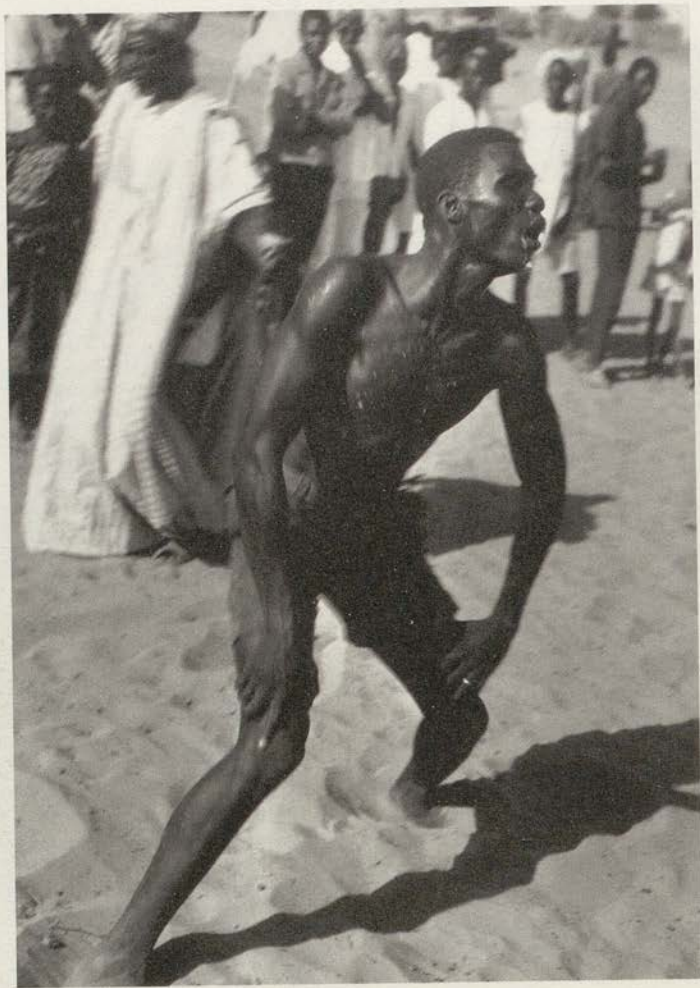
Génie Hauka au yenendi de Gambu, Gambu (Niger), janvier 1961, Enquête sur la religion songhay, Inv. 2000-858-923-BF (vue 29)