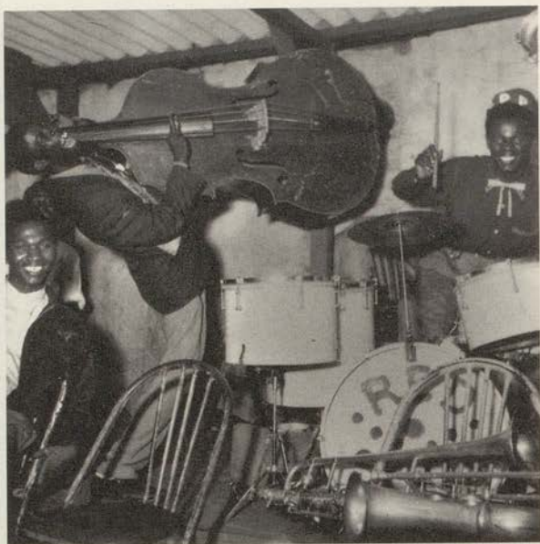
Red Spots au Warren Soudz Club , Accra (Ghana), 1954-1955, Mission " Gold Coast, 1954-1955 ", Inv. 1999-7957-923

MUSEUM NATIONAL D'HISTOIRE NATURELLE MUSEE DE L'HOMME 105.1