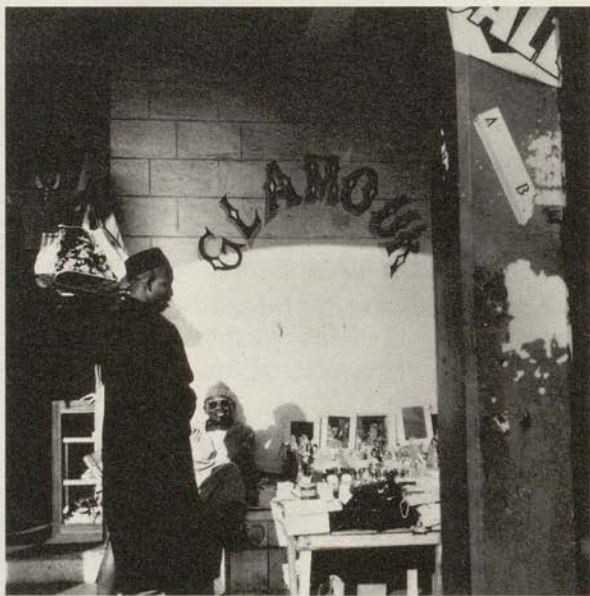
" Glamour ", étale de nyama nyama , Accra (Ghana), 1954-1955, Mission "Gold Coast, 1954-1955", Inv. 2000-2946-923