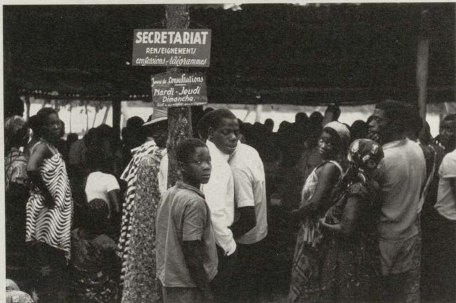
La consultation du dimanche après-midi, Bregbo (Côte d'Ivoire), août 1962, Enquête sur la communauté harriste, Inv. 2000-149-923-BF (vues 14-15)