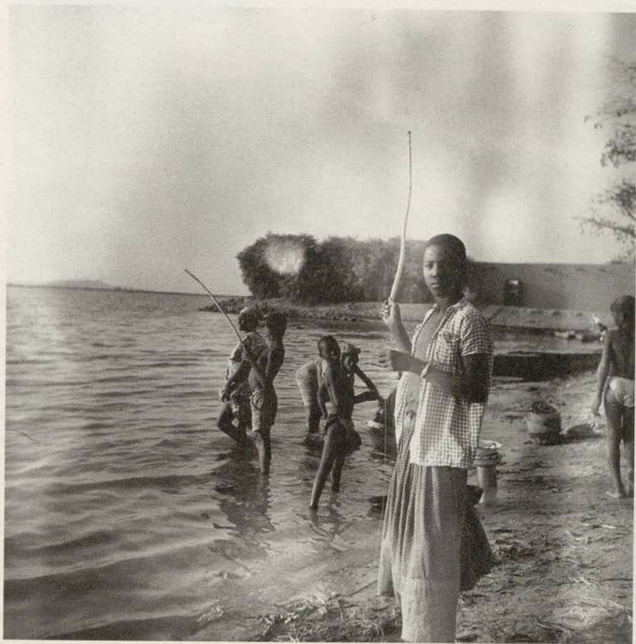
Bord du Niger, Gao (Mali), 1946, Mission " Fleuve Niger ", Inv. 1999-6707-923-E