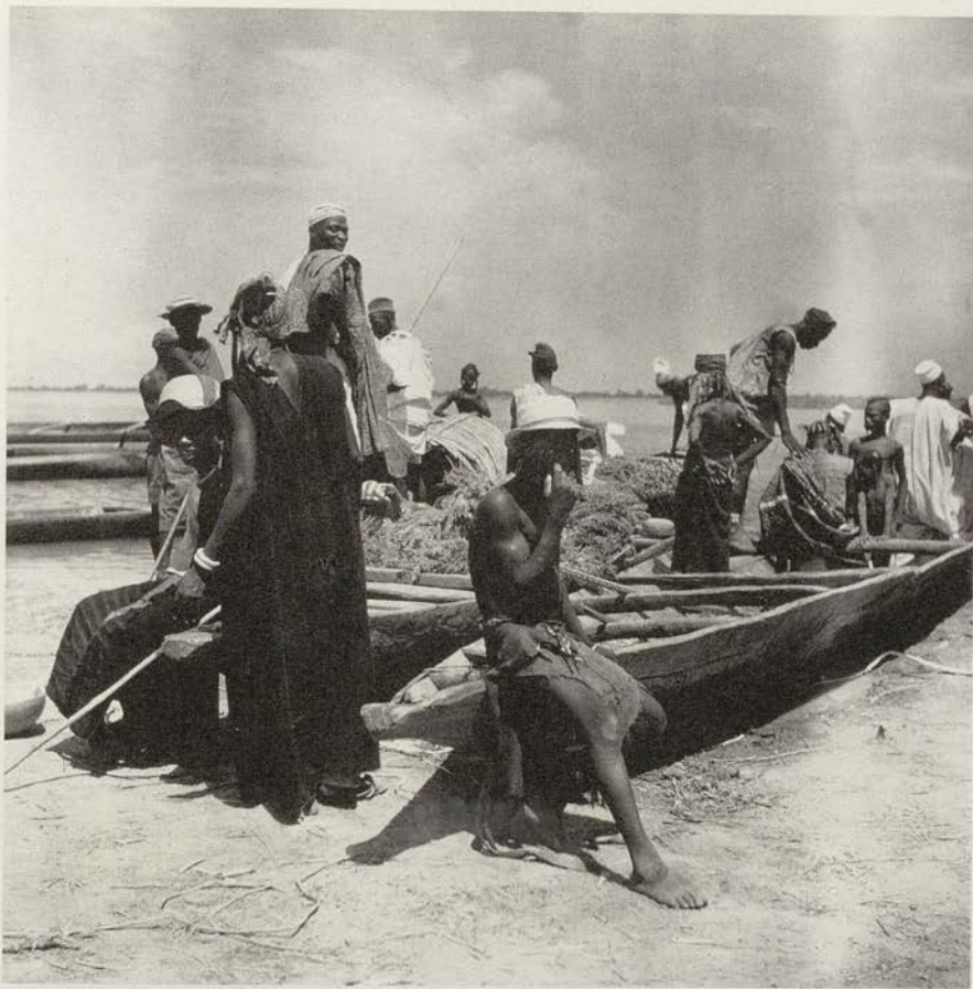
Pirogues habara , Gante (Nigeria), 1947, Mission "Fleuve Niger", Inv. 1999-7045-923-E