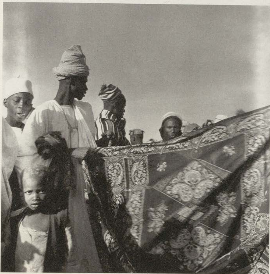
Marchand de pagnes, Gotheye (Niger), 1946, Mission " Fleuve Niger ", Inv. 1999-6771-923-E