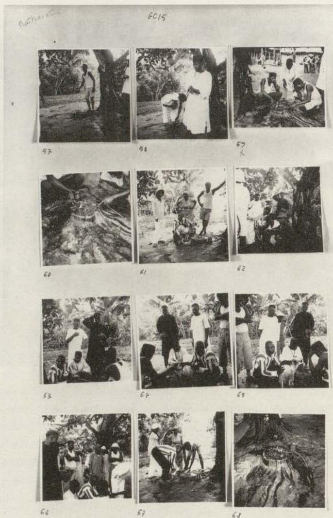
Sacrifices sur l'autel de béton armé, Région d'Accra (Ghana), 1954-1955, Mission " Gold Coast, 1954-1955 ", Tournage du film Les Maîtres fous Inv. 1999-8013-923

Contacts collés sur papier, montage original par Jean Rouch