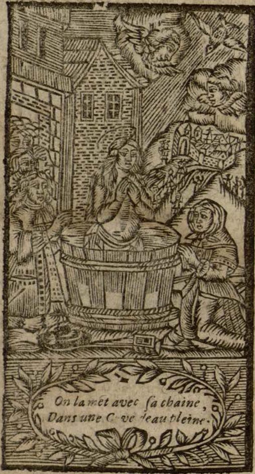
On la met avec sa chaine, Dans une C. ve leau pleine.

V ierge Sainte, & invincible Martyre, qui avez été un Lys de pureté & d'innocence dans les sombres vallées du Paganisme, une Rose vermeille parmi les piquantes épines d'un rigoureux martyre, & une Grenade couronnée dans tou- tes les actions de votre vie. Je vous regarde maintenant dans les derni- res agonies de votre mort, comme cette immortelle qui ne flétrit ja- mais, & qui est le vrai Symbole de votre persévérance jusqu'à la mort dans le service & l'amour de votre divin Epoux. Et comme vous n'a- vez point eu à votre mort de desir plus pressant que de lui aquerir des cœurs qui le servissent fidèlement, présentez-lui le mien, s'il vous plaît.