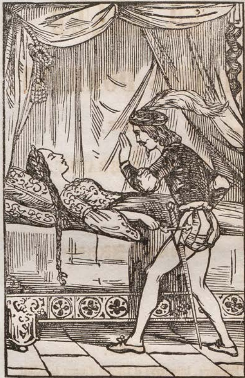
La Belle au Bois dormant.