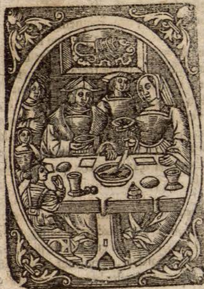
Comme le Roi de Beheine envoya un messager par devers le Roi d'Ansay son frere.

A près il vint un messager à Luxembourg de par le Roi Frederic de Beheine qui étoit un vaillant & moult prud'homme, qui avoit soutenu contre les Sarrazins la foi Catholique. Et partant le Roi de Croco & autres Rois Sarrazins marchant après lui avoient couru sur son pays, car il n'étoit pas assez fort pour cette cause il s'étoit retiré à Prague avec la plus part de ses gens d'armes. Or ce Roi n'avoit point d'heritier qu'une seule fille qui se nommoit Ayglantine, & étoit ce Roi frere du Roi d'Ansay, pour quoi il envoya de vers lui pour avoir secours. Le messager alla droit à Ansay, on lui dit que le Roi étoit à Luxembourg, tant fit le messager qu'il trouva le Roi, & lui presenta les lettres de son frere Frederic, il les ouvrit, & connut par icelles le méchef en quoi son frere étoit, lit tout haut ces lettres que chacun l'entendit.