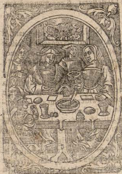
Comme le Roi de Bohême envoya un messenger par devers le Roi d'Ansay son frere.

A près il vint un messenger à Luxembourg de par le Roi Frederic de Beheine qui étoit un vaillant & moult prud'homme, qui avoit soutenu contre les sarrazins la foi Catholique. Et partant le Roi de Croco & autres Rois sarrazins marchant après lui avoient couru sur son pays, car il n'étoit pas assez fort pour cette cause il s'étoit retiré à Prague avec la plus part de ses gens d'armes. Or ce Roi n'avoit point d'heritier qu'une seule fille qui se nommoit Aÿglantine, & étoit ce Roi frere du Roi d'Ansay, pour quoi il envoya devers lui pour avoir secours. Le messenger alla droit à Ansay, on lui dit que le Roi étoit à Luxembourg, tant fit le messenger qu'il trouva le Roi, & lui presenta les lettres de son frere Frederic il les ouvrit, & connut par icelles le méchef en quoi son frere étoit, lit tout haut ces lettres que chacun l'entendit.