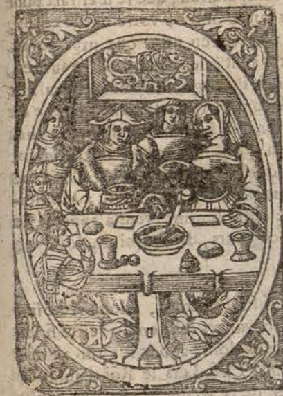
Comme après dîner les Chevaliers jouterent.

QUand l'aube du jour apparut, la matinée fut belle & clair, adonc l'épousée fut notablement appareillée & fut amené où la Messe & solennité se devoit faire, le furent honorablement, receus, puis elle fut ramenée au pavillon, quand le dîner fut prêt, ils lavent les mains s'assirent à table, en laquelle ils furent richement servis de plusieurs viandes fort exquisites, & après qu'ils eurent dîné & que les nappes furent ôtées ils se leverent, puis leverent les mains, & furent les tables abbatues, graces dites. Après les Dames allerent à leurs tentes, les nobles Chevaliers s'en allerent armer, & même Antoine si si en alla bien armé & équipé pour faire plus grand plaisir & honneur à son frere Regnaut.