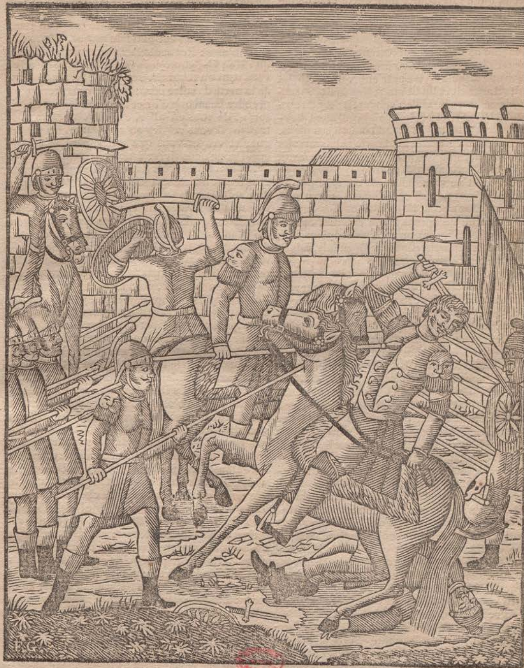
Le traître Ganelon tue le duc Beuves d'Aigremont.