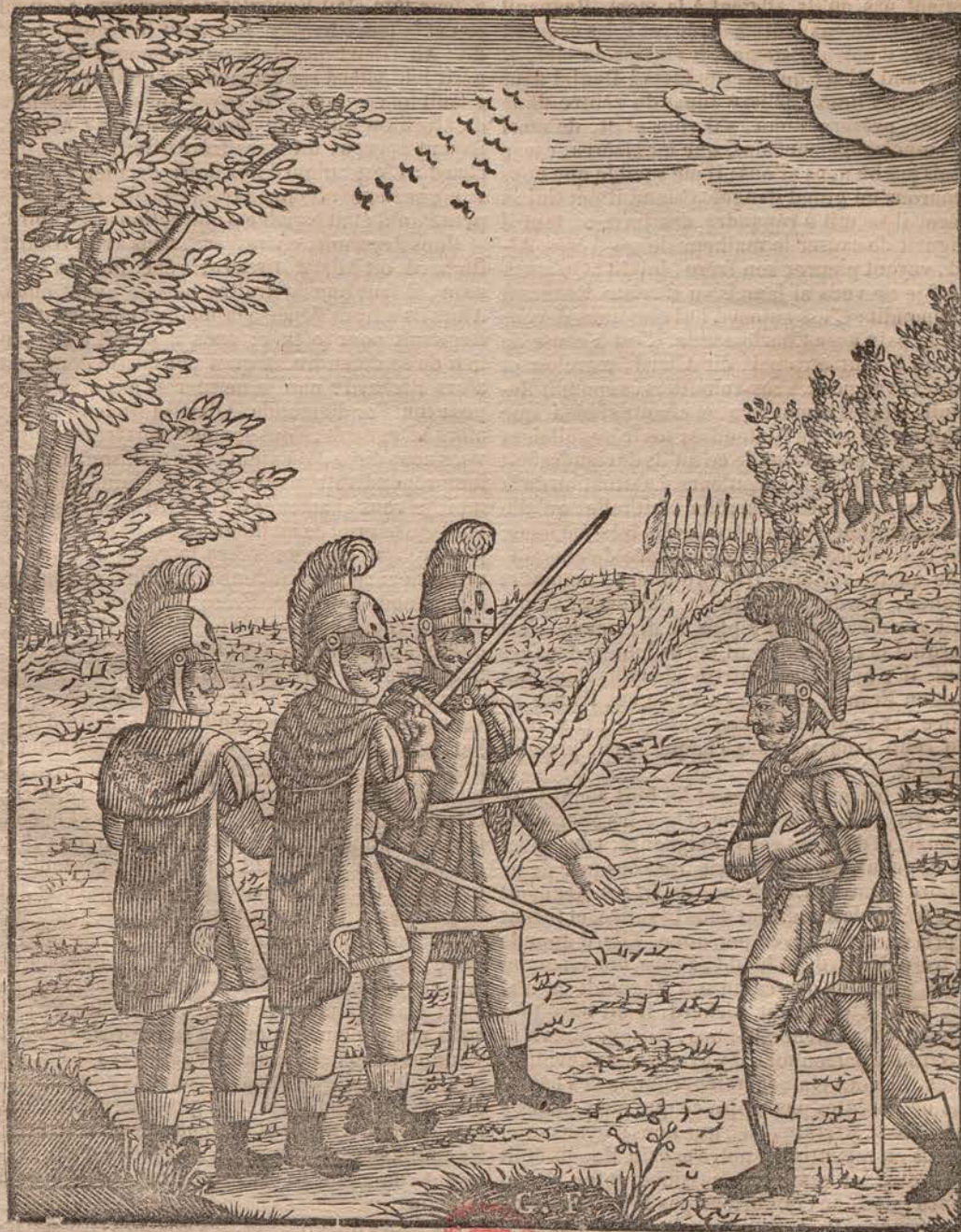
Les trois frères, l'épée à la main, veulent tuer Regnault.