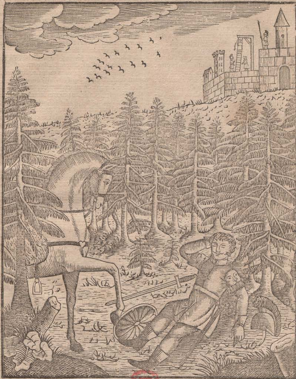
Buzard réveille Regnault en frappant sur son écu.

Charlemagne appela Ripus, et lui dit: Si vous voulez pendre Richard, je vous ferai mon chambellan. Je le veux bien, lui répondit-il, car Regnault a tué mon oncle au gué de Balançon. Vous ferez bien d'en tirer vengeance, lui dit Oger. Ripus dit au roi: Promettez-moi qu'aucun des douze pairs de France ne m'en saura mauvais gré. Le roi le fit promettre à tous ses barons. Ripus alla s'armer et revint vers le roi, qui lui dit de conduire avec lui mille chevaliers, pour se défendre en cas que Regnault voulût délivrer Richard. On lui livra Richard, il lui passa une corde au cou comme à un larron, et le fit passer devant la tente de Charlemagne, qui fut bien satisfait. Ripus