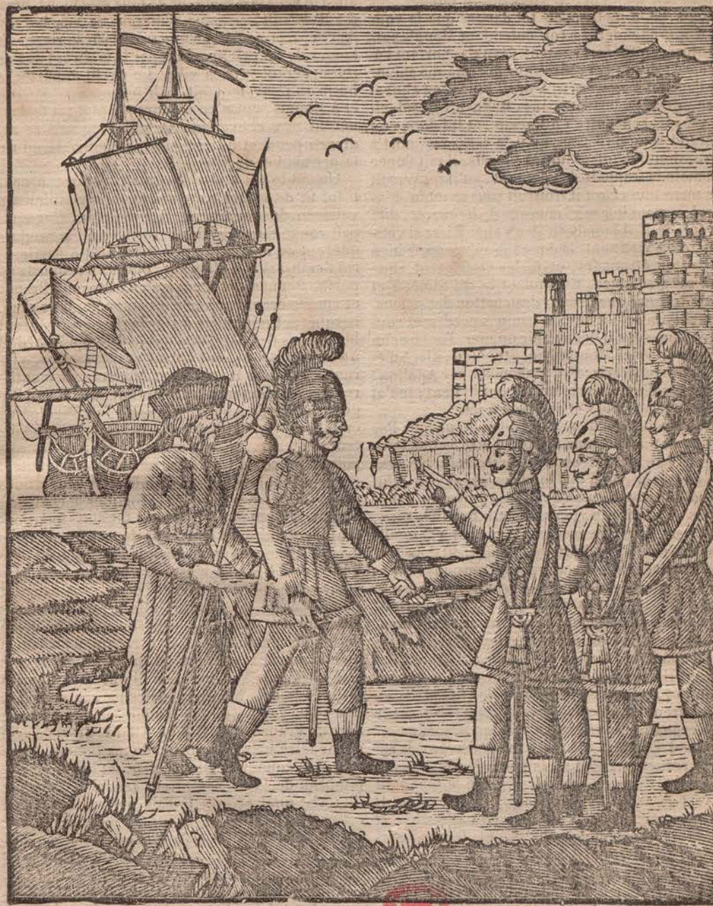
Regnault et Maugis s'embarquent au port de Japhet.