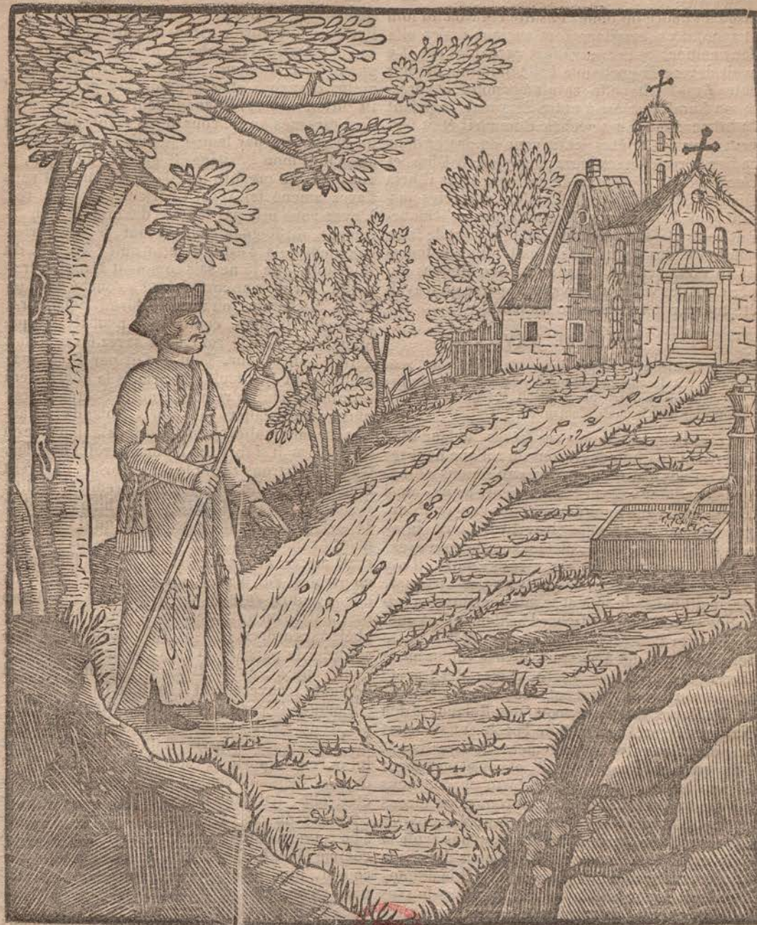
Maugis se rend dans un ermitage.

Quand Maugis eut rendu Charlemagne prisonnier à son cousin Regnault, il s'en alla de Montauban sans le dire à personne du château, sinon au portier. Alors il marcha tant, qu'il arriva à Dordogne et passa la rivière; quand il fut tout-à-fait passé, il se mit dans un bois épais et marcha