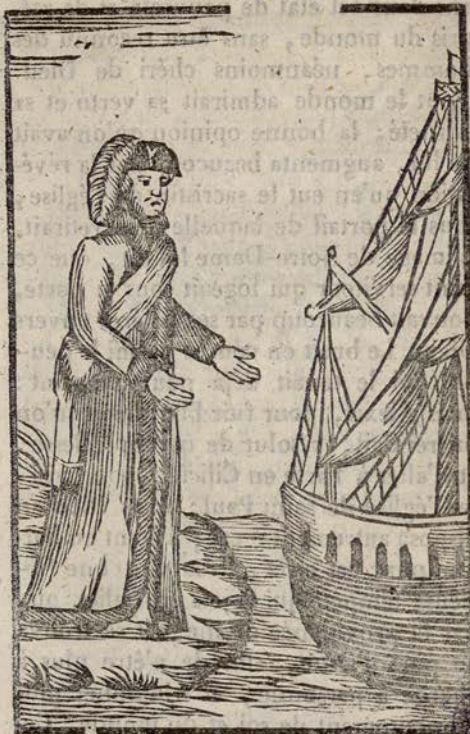
Saint Alexis déguisé quitte son épouse et trouve un navire qui le mène en Laodicée.

Alexis, content de son sort, remercia Dieu de ce qu'il était réduit à demander l'aumône à ses serviteurs. Il fut cinq