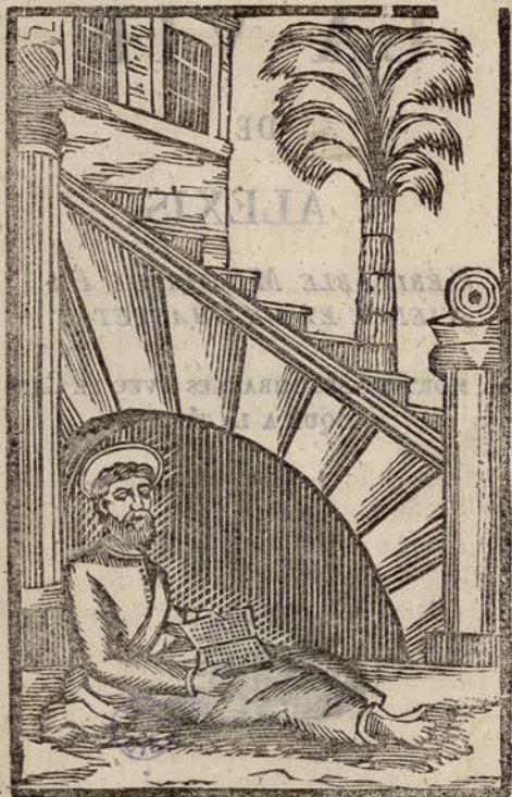
S. ALEXIS Saint Alexis, priez pour nous.