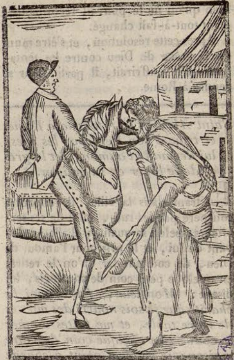
Saint Alexis reçoit l'aumône dans les rues d'Edesse.

ans dans cet état de pauvreté et de mépris du monde, sans être reconnu des hommes, néanmoins chéri de Dieu. Tout le monde admirait sa vertu et sa sainteté; la bonne opinion qu'on avait de lui, augmenta beaucoup par la révélation qu'en eut le sacristin de l'église, sous le portail de laquelle il se retirait. L'image de Notre-Dame lui dit, que ce saint serviteur qui logeait sous la porte, pouvait beaucoup par ses prières envers Dieu. Le bruit en courut parmi le peuple qui le tenait déjà pour un saint: mais Alexis, pour fuir l'honneur qu'on lui rendait, résolut de quitter Edesse, et d'aller à Tarse en Cilicie, pour visiter l'église de saint Paul: mais Dieu en disposa autrement: car, s'étant embarqué pour cet effet, il survint une furieuse tempête qui le jeta en Italie, où, par la providence divine, il se trouva au port d'Ostie, afin de n'être plus à charge à personne, et triompher plus glorieusement de soi et du monde. Cependant il résolut de retourner à Rome en la maison de son père, où il savait