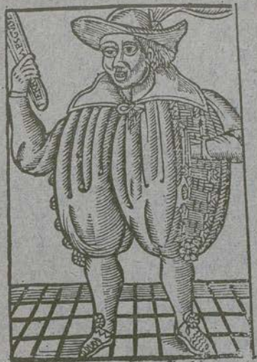
N o 46

Enfin, voici le jour qu'il faut que je vous quitte, Puisse-je mourir & que l'un de ma suite